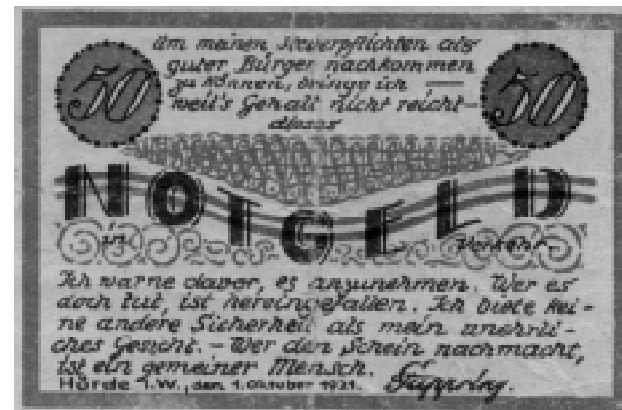
Hörde "Spaßgeldschein" 1921